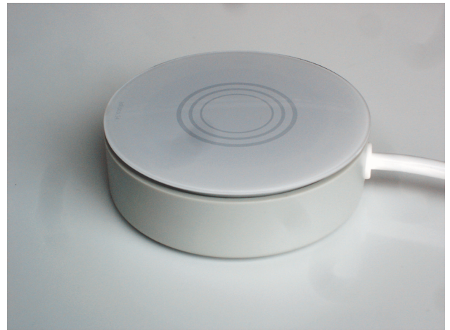
adhoco.S4 : funkgesteuerter Dimmer mit Erkennung der Lastart

Selbstlernerneffekt: Durch das manuelle Bedienen über den eingebauten Schalter oder die adhoco.R1 Fernbedienung erkennt die Zentrale adhoco.H1 die Vorlieben des Benutzers und passt das Schaltprogramm der adhoco.H1 Zentrale automatisch an (siehe Handbuch adhoco.H1 ).