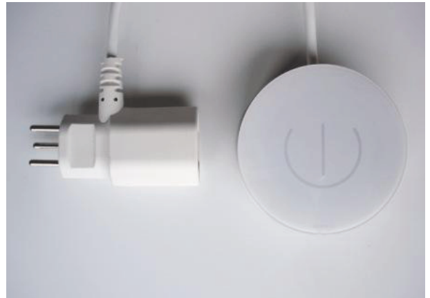
adhoco.S3 : funkgesteuerter Leistungsschalter für den Anschluss an eine Steckdose

Selbstlernerneffekt: Durch das manuelle Bedienen über den eingebauten Schalter oder die adhoco.R1 Fernbedienung erkennt die Zentrale adhoco.H1 die Vorlieben des Benutzers und passt das Schaltprogramm der adhoco.H1 Zentrale automatisch an (siehe Handbuch adhoco.H1 ).